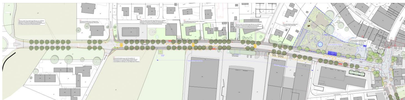
Abbildung 2: Teilprojekt 1

Das vorliegende Bauprojekt umfasst die Umgestaltung der Birrfeldstrasse vom neuen Kreisell der Umfahrung bis zum Lindenplatz (Teilprojekt 1). Parallel dazu wird die Lenzburgerstrasse in einem separaten Teilprojekt geplant.