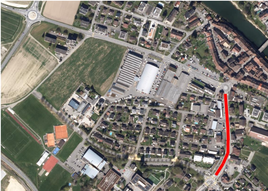
Abbildung 1: Projektperimeter Teilprojekt 2

Durch die Eröffnung der Umfahrung hat sich die Funktion der Lenzburgerstrasse verändert. Sie dient heute hauptsächlich der innerörtlichen Erschliessung und weniger dem Durchgangsverkehr. Dadurch ergibt sich die Möglichkeit, den Strassenraum neu zu gestalten und besser an die Bedürfnisse der Bevölkerung anzupassen. Im Vordergrund stehen dabei eine höhere Verkehrssicherheit, attraktivere Aufenthaltsbereiche sowie eine Aufwertung des Ortsbildes.