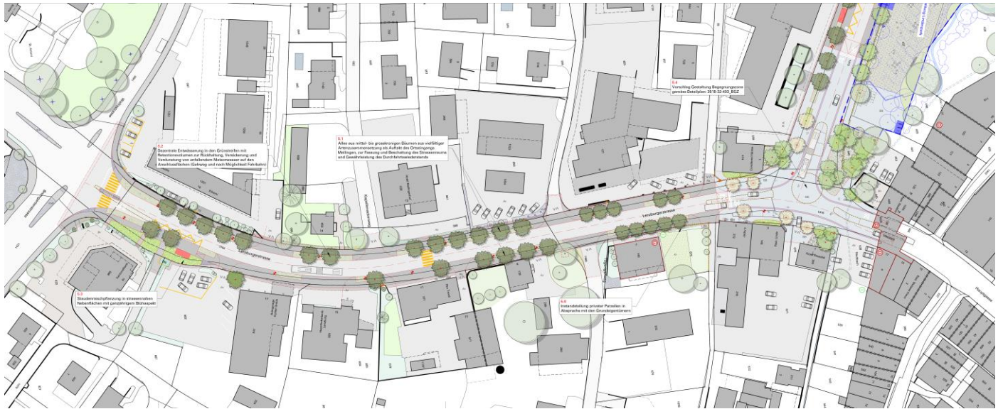
Abbildung 2: Teilprojekt 2